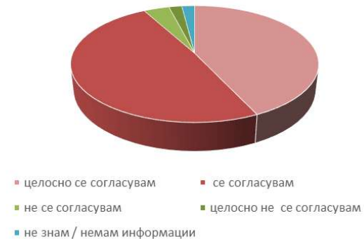
Тврдење: Запознаен сум со училишниот протокол за превенција и постапување во случај на насилство

На анкетата на тврдењето „Запознаен сум со училишниот протокол за превенција и постапување во случај на насилство“ - најголем број од родителите или вкупно 92% целосно се согласуваат или се согласуваат со тврдењето, а незначителен број односно вкупно 6% не се согласуваат или целосно не се согласуваат со тврдењето, додека незначителен број на родители односно 2% не се согласуваат со тврдењето.